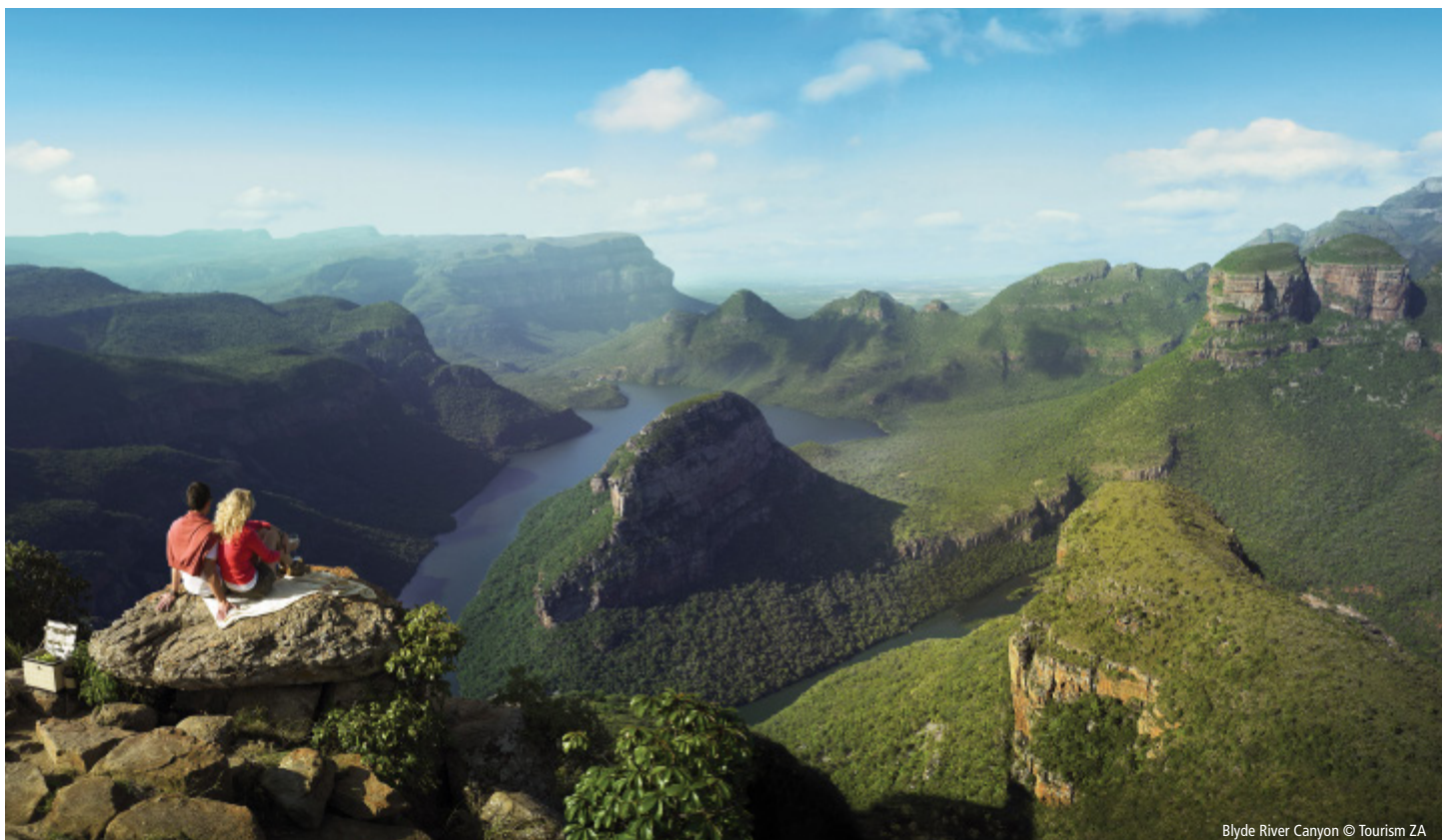
Blyde River Canyon

Nach einer Morgenpirsch fahren Sie in Richtung Süden in das unabhängige Königreich Swasiland, welches durch seine hügelige Landschaft auch die Schweiz Afrikas genannt wird. Das erforderliche Visum erhalten Sie an der Grenze. Hier, in Afrikas zweitkleinstem Staat,